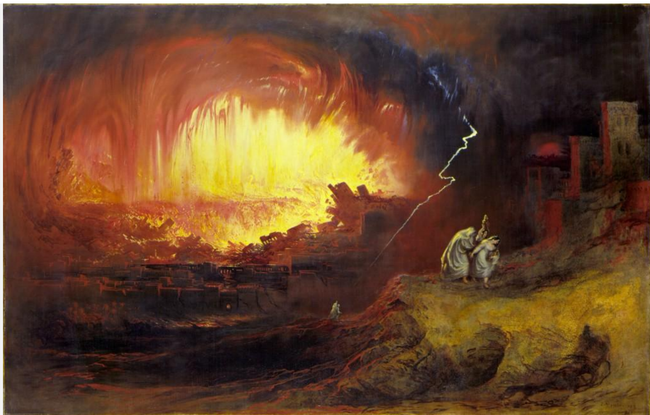
Джон Мартин: Содом и Гоморра

«Бог не оставит безнаказанными богохульников», — заявляет премудрый Соломон (Прем. 1, 6). История свидетельствует, что действительно многие города и даже могущественнейшие государства пали вследствие своей разнузданности, развратной и позорной жизни своих жителей. Новейшие раскопки погибшего от извержений Везувия города Помпеи рассказывают постыднейшую картину гнусных пороков жителей этого второго Содома.