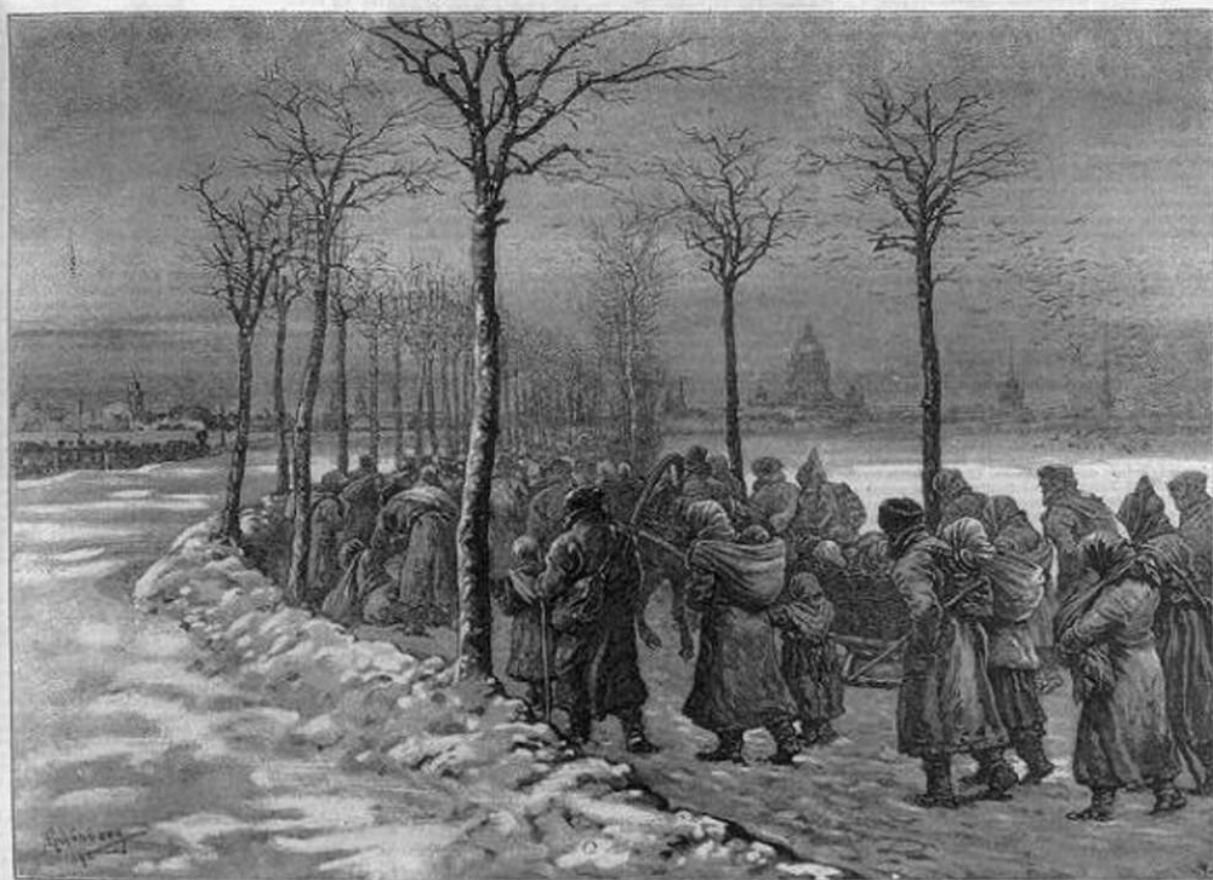
FAMINE-STRIKEN VILLAGERS WHO HAVE LEFT THEIR HOMES ON THE WAY TO ST. PETERSBURG.

особенно в столицах, все места увеселений и разгула переполнены народом: билеты в театры, кинематографы, иллюзионы берутся нарасхват. Рестораны, трактиры, кафе-шантаны шумят, как пчелиный рой, веселящимся народом.